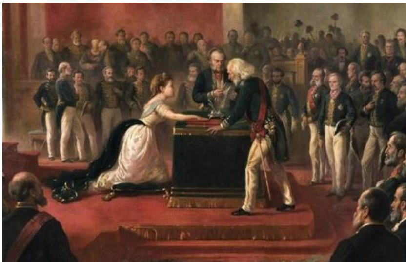
Princesa Isabel - Juramento da Constituição (Óleo de Victor Meireles, Museu Imperial de Petrópolis)